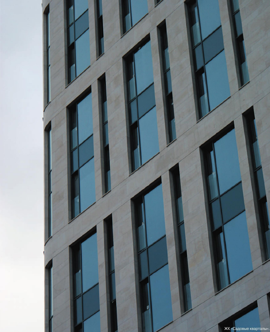
ЖК «Садовые кварталы».