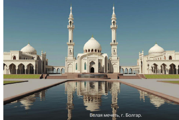
Белая мечеть, г. Болгар.